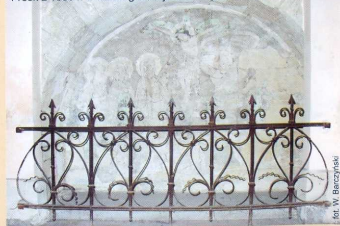
Fresk z 1380 r. w nawie głównej kościoła pod chórem