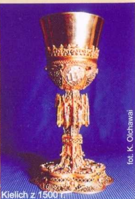
Kielich z 1500 r.