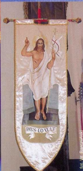
Sztandar Zakonu Rycerskiego Grobu Bożego w Jerozolimie