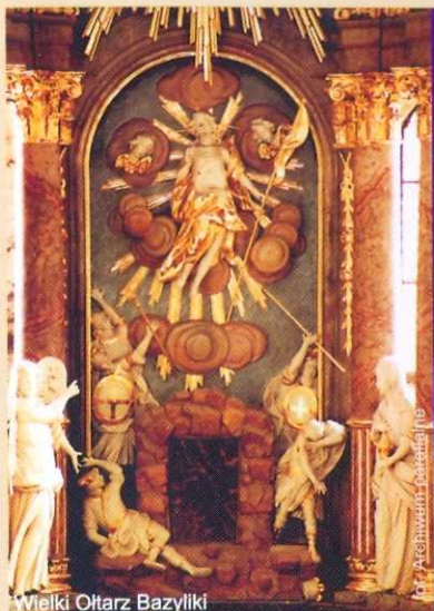
Wielki Ołtarz Bazyliki