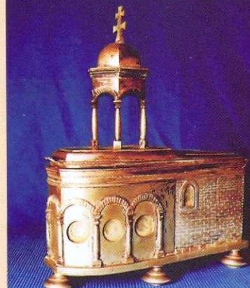
Relikwiarz sprzed 1584 r.